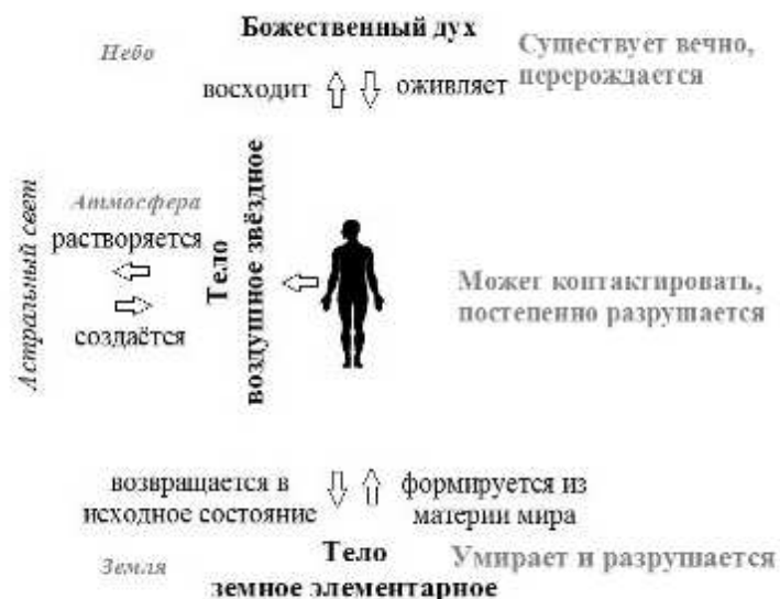
Илл. 2. Разделение единого существа (человека) на отдельные составляющие (тела) согласно работам Э. Леви, с указанием миров, в которых они пребывают.

Очень схоже у Леви и Блаватской описание «вампиров», которые являются результатом влечения к физическому миру и следствием деятельности тех, кто стремится призывать души умерших. Леви пишет: «Тот, кто позволил бы себе привлечь посредством колдовства души, плавающие в темноте, но стремящиеся к свету, тот породил бы ущербных и посмертных детей, <...>. Некроманты являются производителями вампиров, и они не заслуживают жалости, если умирают, сожранные мертвецами» 1 . Схожи воззрения Блаватской и Леви и в отношении медиумов, они неоднократно предупреждают об опасности спиритуализма и других видов контактов с умершими 2 . Ограничения на контакт с умершими в работах Елены Петровны обусловлены не только моральными принципами, но также опасностью такого контакта для вызываемого и для вызывающего. Ограничениями являются и внешние условия, основанные на теософском способе понимания устройства мира и процессов, происходящих в нем: